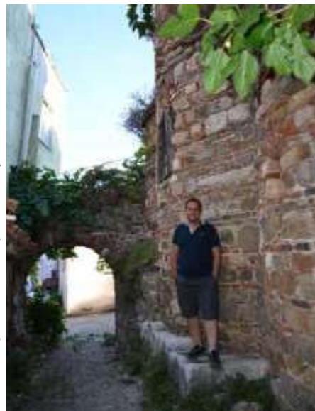
Ο Ιερός Ναός Παναγίας Παντοβασίλισσας Τρίγλιας

Βλέπουμε από τα ερείπια που υπάρχουν ότι τα Μοναστήρια της Βυζαντινής εποχής ότι εκτείνονταν σ' ένα πολύ ευρύ πεδίο. Είναι γνωστό ότι υπάρχουν επίσης ερείπια στην νότια πλευρά του Ολύμπου. Ένα από αυτά είναι Η Βασιλική Derecik (Ντερετσίκ) στην ομώνυμη συνοικία της Κωμόπολης Büyükorhan. Το 2001 σε μια παράνομη ανασκαφή που έγινε ανακαλύφθηκε ένα μωσαϊκό δαπέδου. Στην Βασιλική αυτή που χρονολογείται από τον 4ο αιώνα τα επόμενα χρόνια έγιναν ανασκαφές από το Μουσείο Προύσας στον γύρω χώρο και το μωσαϊκό προστατεύτηκε. Προέκυψε από τις ανασκαφές που έγιναν ότι η Βασιλική είχε καεί στα τέλη του 9ου αιώνα.[68] Στην συνοικία Gelemis του Keles, στην τοποθεσία Pelitören, υπάρχουν τα ερείπια Βυζαντινής – ίσως Μονής – Εκκλησίας. Είναι γνωστό ότι στην περιοχή υπάρχουν και άλλα ερείπια εκκλησιών και μοναστηριών.[69] Στην περιοχή των Εκκλησιών του Orhaneli, στο χωριό Kusumlar, στα χωριά Belenören και στις περιοχές Kiranışıklı και Çayırli του Keles υπάρχουν ερείπια βασιλικών της Βυζαντινής εποχής. Στον τοπικό τύπο, υπάρχουν συχνές αναφορές για τις παράνομες ανασκαφές από θησαυροθήρες στις περιοχές Orhaneli, Keles, Büyükorhan και Harmancık.