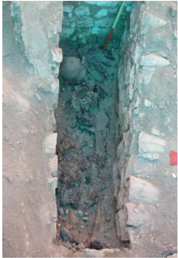
Εικόνες του χώρου ανασκαφών του Ι. Ν. Κοιμήσεως της Θεοτόκου Παλατίων Σινώπης