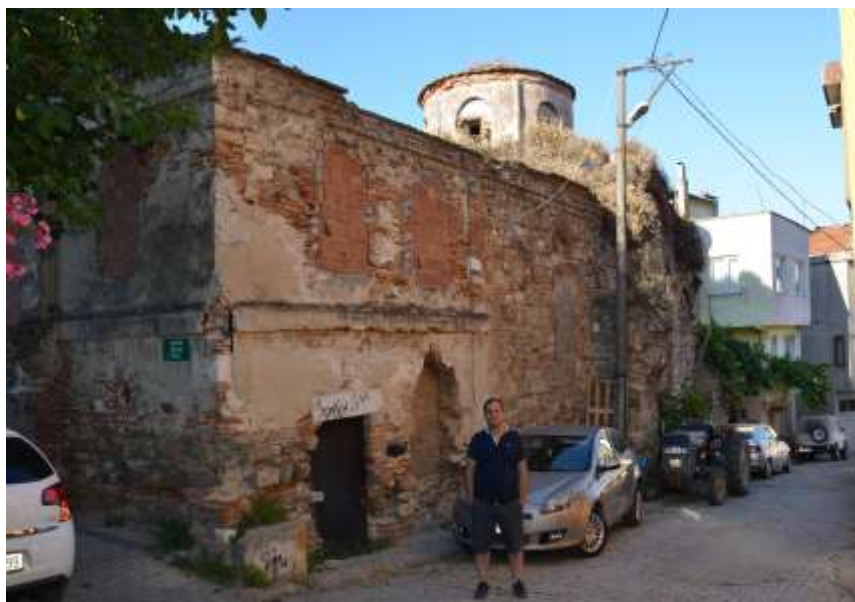
Ο Ιερός Ναός Παναγίας Παντοβασιλίσσας Τρίγλιας