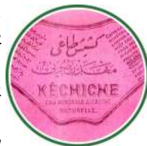
Μεταλλικό νερό του 1912 της Προύσας

Αναγέρθηκαν πάνω από εκατό μοναστήρια στους πρόποδες, φαράγγια και παραλίες κοντά στον Όλυμπο. Τα αγιολογικά κείμενα των Αγίων του Πέτρου της Ατρώας και Ιωαννίκου αποτελούν πρωτογενείς πηγές για τα μοναστήρια του Ολύμπου εκείνης της περιόδου. Είναι γνωστό ότι, η πλειοψηφία των μοναχών που ζούσαν στα μοναστήρια αυτά είχαν συμβιβαστεί με την εξουσία του εικονομάχου Αυτοκράτορα Λέοντα (813-820). Μάλιστα οι εικονολάτρες μοναχοί, που δεν υπάκουσαν στην Αυτοκρατορική εξουσία, εξαναγκάστηκαν από τον Ηγούμενο να διασκορπιστούν για να μην συλληφθούν. Τέλος είναι γνωστό ότι μετά από το τέλος της εικονομαχίας υπήρξε αύξηση της δραστηριότητας των μονών της περιοχής αυτής.[11]