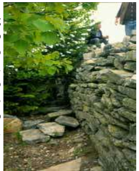
Φωτογραφίες τοίχων που πιθανά ανήκουν στην Μονή Φωτεινουδιών

Μοναστήρι ανακαινίσθηκε, είναι γνωστό ότι υπέστη σοβαρές ζημιές στον σεισμό του 1855 της Προύσας.[82] Την περίοδο αυτή ξαναχτίστηκε η εκκλησία που άρχισε να λειτουργεί από τον Απρίλιο του 1856. Σήμερα σώζονται ερείπια της εκκλησίας. Η αρχιτεκτονική της είναι σταυροειδής εγγεγραμμένη σε κύκλο και το άνω τμήμα της έχει καταρρεύσει. Σε απόσταση 75 μέτρων στην βορειανατολική κατεύθυνση υπάρχει σκαμμένο σε βράχο κελί μοναχού ο οποίος έδωσε το όνομα στη Μονή.[83]